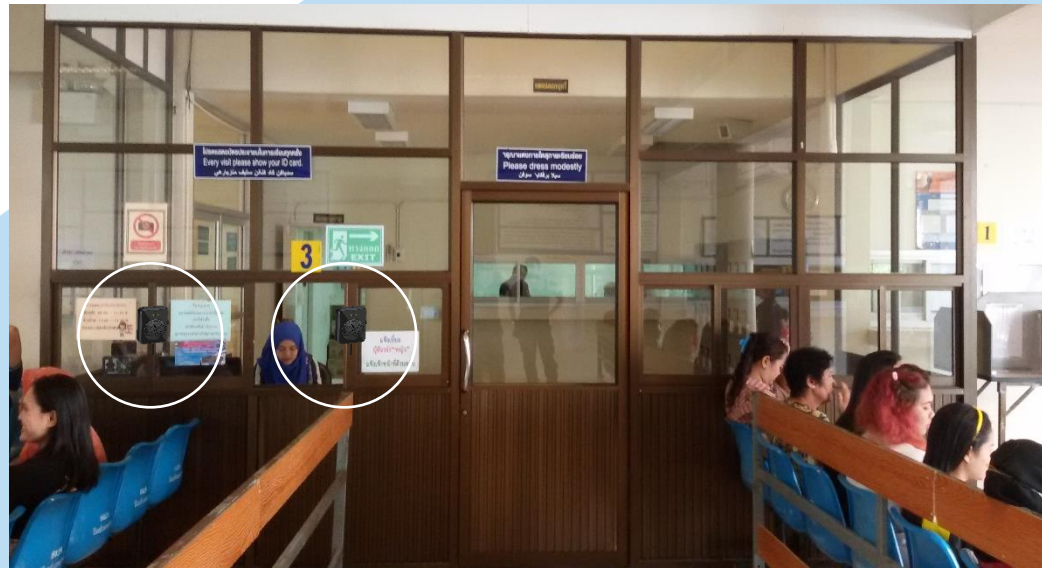
ญาติรอประกาศเรียกชื่อเยี่ยมผู้ต้องขัง